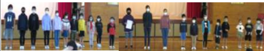
総合優勝「5班」 みんながんばったで賞「6班」

した児童の表彰も行いました。この朝会を通して、単に運動をすることの大切さだけでなく、班の一員として自分のできる努力をして、班の仲間に貢献することの大切さ、結果だけを見るのではなく、努力する事の大切さについて学んでほしいと思っております。ぜひご家庭でも話題にしてみてください。ありがとうございました。