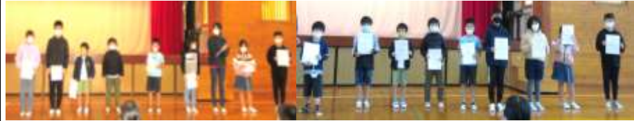
「各跳び方部門チャンピオン」 「とてものびたで賞」