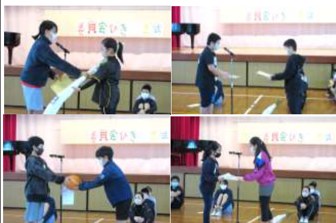
「委員会引き継ぎ式」