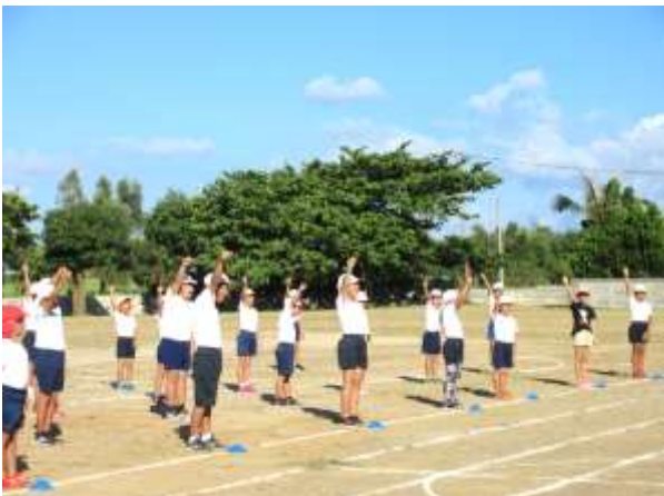
運動会がんばるぞ！オー！

これから暑い中での運動会練習が続きます。コロナ感染症対策や熱中症にならないよう気をつけながら練習に取り組んでいきます。子ども達も普段より疲れが出るのが予想されますので、ご家庭でも、十分な睡眠やバランスの良い食事など、運動会当日へ向けてのご協力をよろしくお願いします。